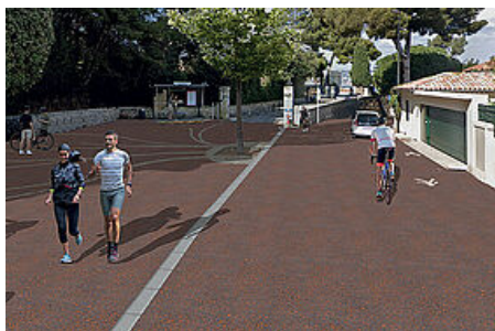
Zone de rencontre devant Posidonia, Espace Mer & Littoral