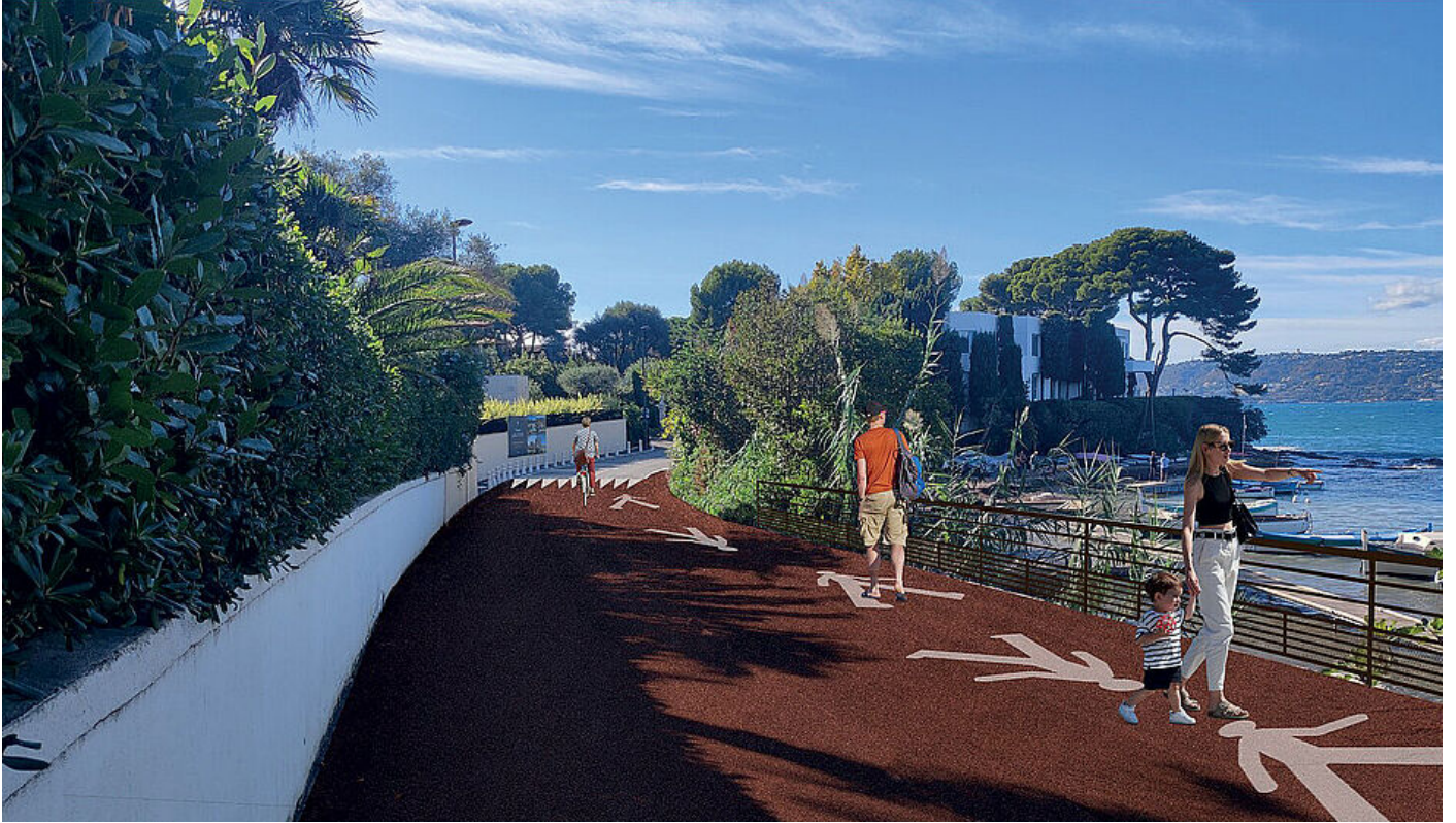
Zone de rencontre au-dessus du port de l'Olivette