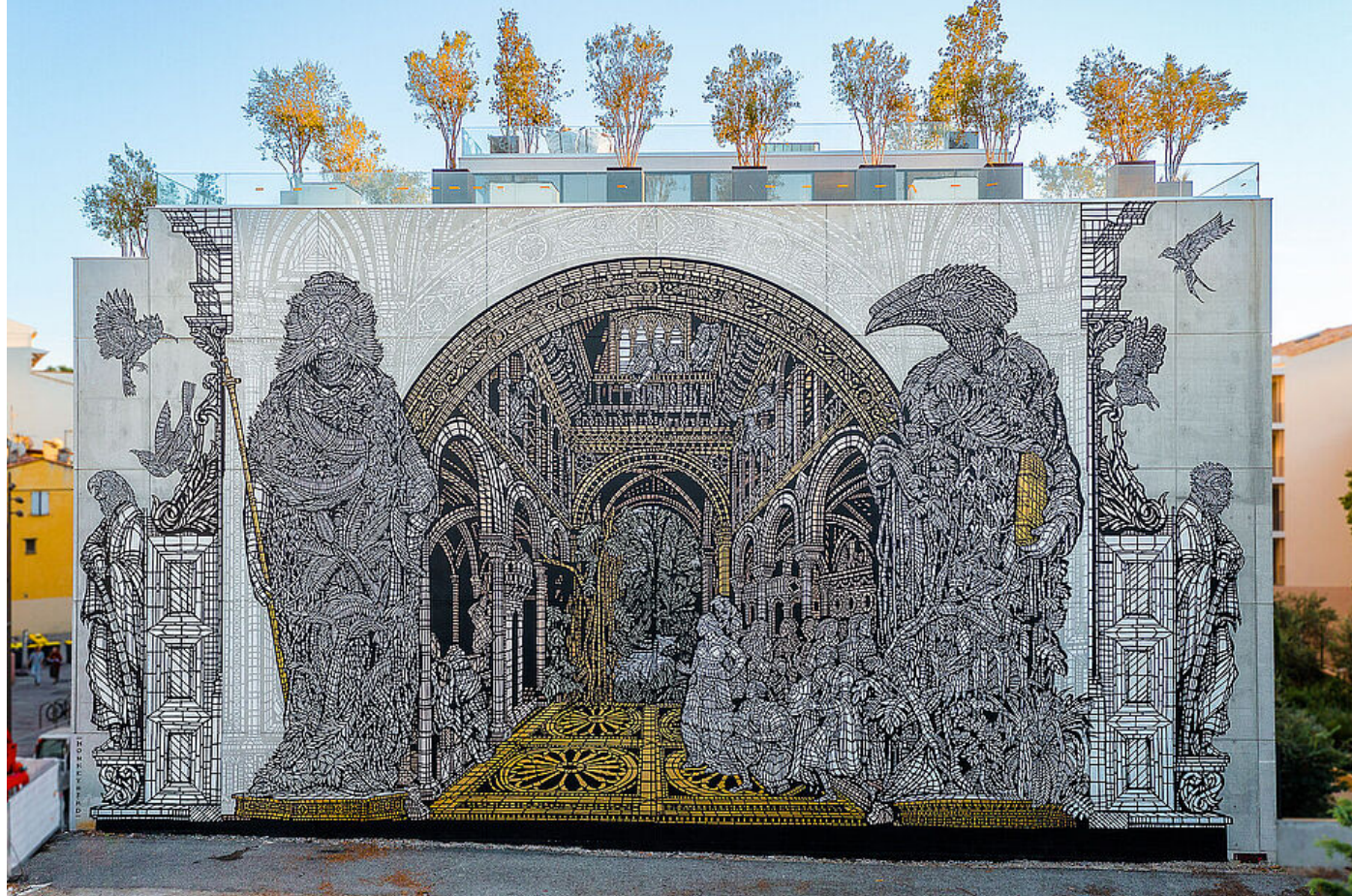
Fresque monumentale sur Marenda-Lacan