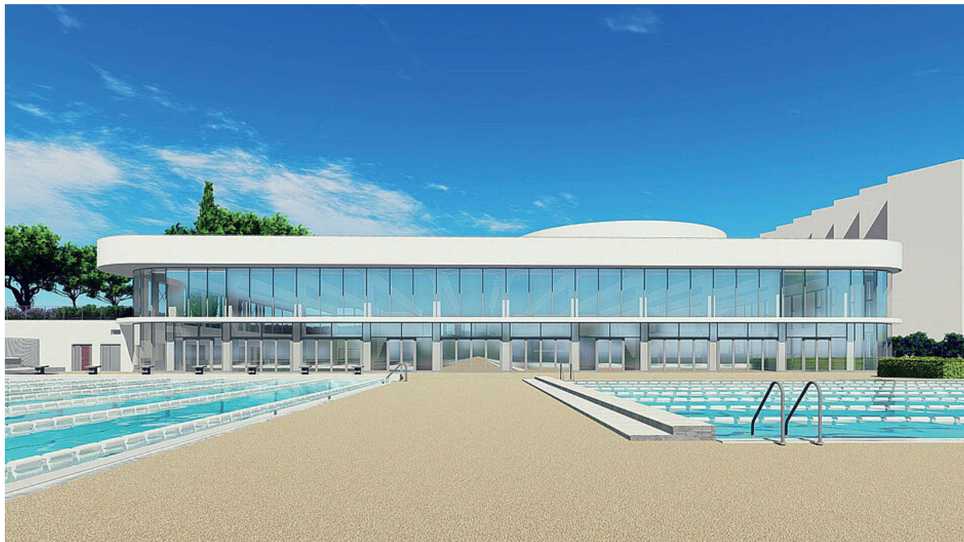
Un vue d'extérieur du stade nautique

** Accueil de jeunes nageurs à haut potentiel, issus de pays en développement et bénéficiaires d'une bourse de la fédération internationale de natation, pour les aider à se développer (World Aquatics)