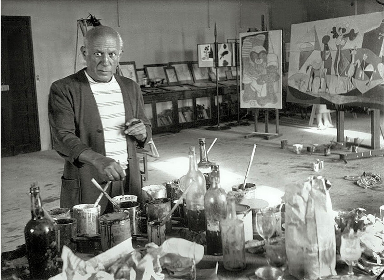
Picasso dans son atelier

Le 22 septembre 1947 voit l'inauguration officielle de la salle Picasso au premier étage, accompagnée d'un premier accrochage des œuvres d'Antibes.